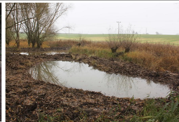
Zdroj: Sweco – obnova vodního režimu ve Vesci u Sobotky